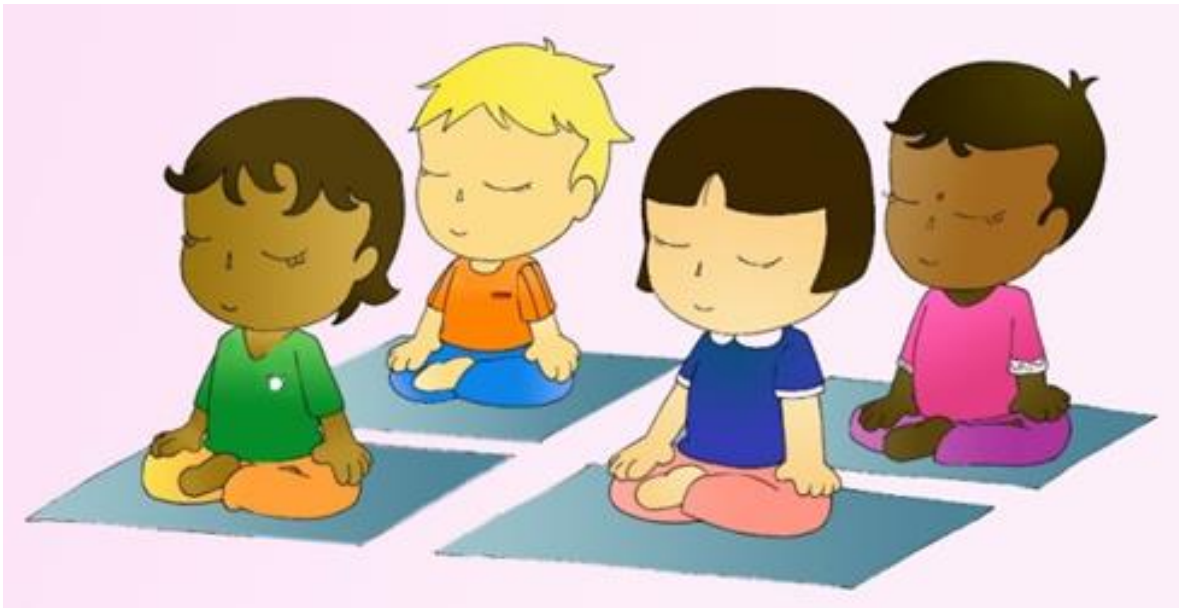
Ilustración 1. 17 JUEGOS Y TÉCNICAS DE RELAJACIÓN PARA NIÑOS | Aprende by aprendebytuaulaonline.es